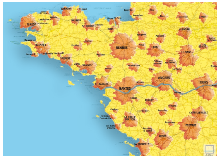
Une géographie de bassins de vie

L'Agence réalise également des analyses comparatives entre villes et systèmes métropolitains, aux échelles départementale, régionale, nationale et européenne.